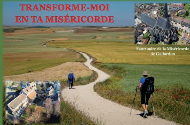
Sanctuaire de la Miséricorde de Gallardon

Maison de la Miséricorde de St Symphorien le Château (27 rue Guy de la Vasselais)