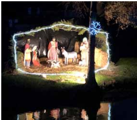
crèche étang de Brezolles