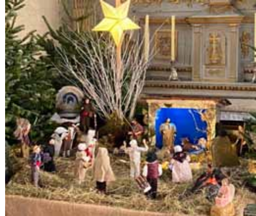
crèche église Châteauneuf

lui qui nous a aimés, et il a envoyé son Fils en sacrifice de pardon pour nos péchés. » (1Jn 4,7) Dieu vient vers nous avant même que nous pensions qu'il est là. »