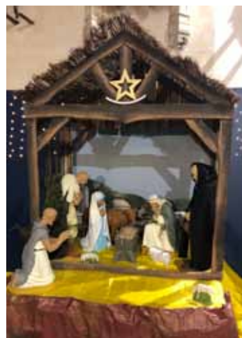
crèche église Brezolles

La crèche est belle. Elle peut être développée comme en Provence avec des santons nombreux, des rivières et des maisons, mais il y a toujours ce lieu intime de la naissance, vers où les yeux sont attirés. Le mystère présenté est celui de l'incarnation : la venue, dans la chair, du Verbe divin, le Fils de Dieu. Y a-t-il de plus grand mystère que Dieu qui se fait homme, pauvrement, humblement ? Qui s'abaisse jusqu'à nous ? L'infini vient dans le fini. Le pur Esprit prend un corps. Dieu s'unit à l'homme. L'Enfant-Dieu rejoint l'humanité dans l'humilité d'une crèche. La tendresse de Dieu se fait proche. Dieu vient réjouir et consoler les hommes et les femmes qui s'ouvrent à sa présence. L'arrivée des bergers, les premiers prévenus par les anges, manifeste le désir de Dieu de se révéler en premier aux petits et aux pauvres, à ceux dont le cœur n'est pas encombré par les richesses et les soucis. Le pape François dit que « la crèche est une invitation à « sentir » et à « toucher » la pauvreté que le Fils de Dieu a choisie pour lui-même dans son incarnation. » Aussi, le disciple bien-aimé Jean peut-il affirmer « voici en quoi consiste l'amour : ce n'est pas nous qui avons aimé Dieu, mais c'est