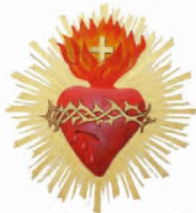
SACRÉ-COEUR DE JÉSUS